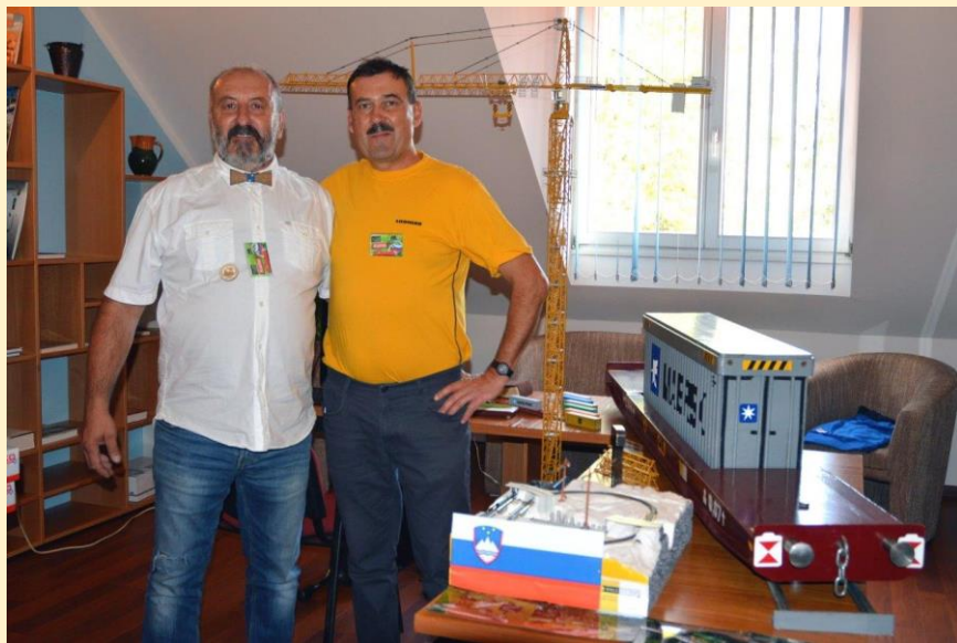
... Slovenije, Prosečke vasi v Prekmurju