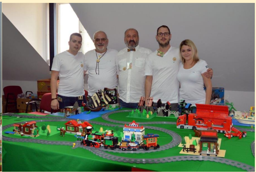
... Avstrije in Madžarke