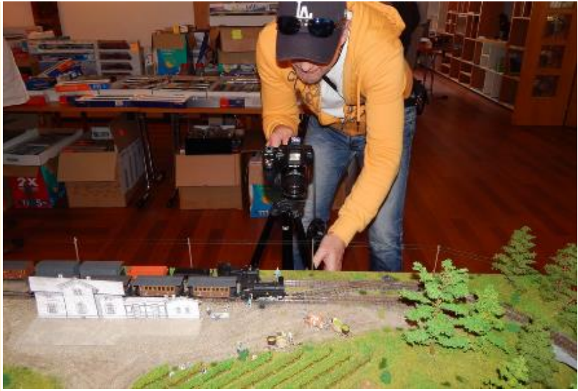
Zanimanje za razstavo železniških maket je fotografiral tudi Leo Roudi – Sini